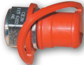
Арт. № 01453