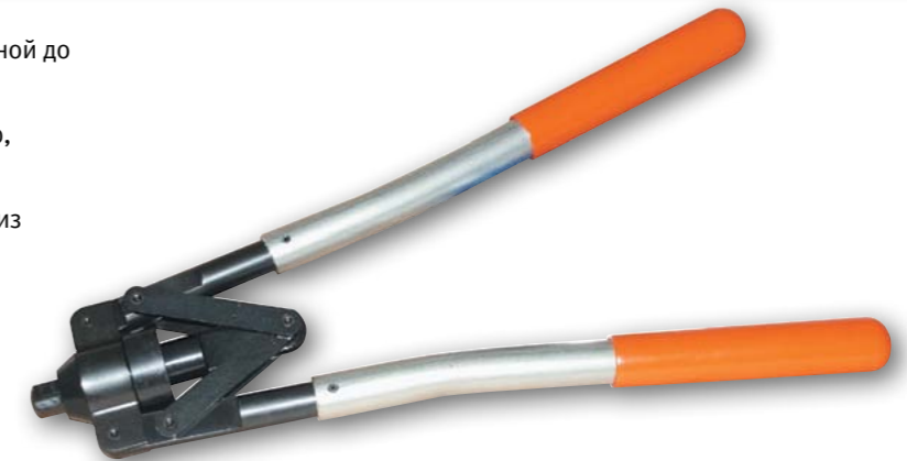
Арт. № 03015