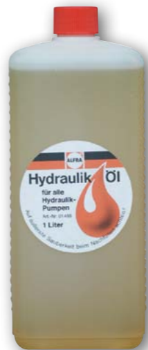
Арт. № 01455

Внимание: при заправке гидравлических агрегатов следует соблюдать абсолютную чистоту!