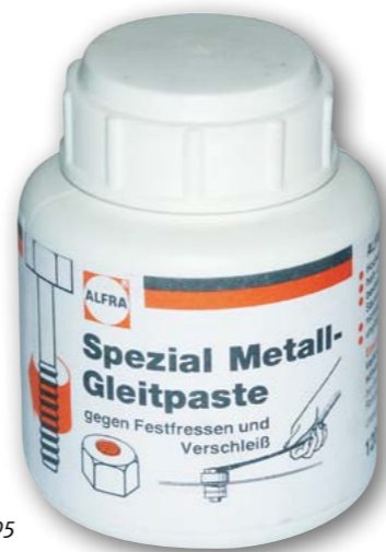
Арт. № 33005

Обязательно использовать при работе с листовыми штампами посредством гаечного ключа.