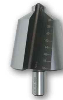
Арт. № 09005