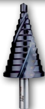
Арт. № 08081 •