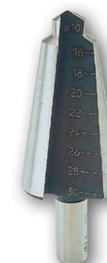
Арт. № 09003