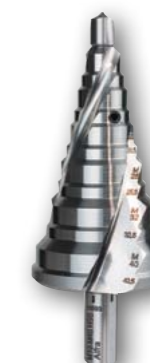
Арт. № 08084 •