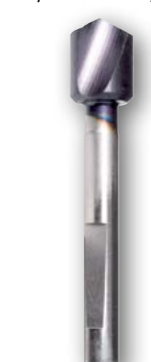
Арт. № 08008

• сменное центровое сверло * с 4-мя выемками для стружки