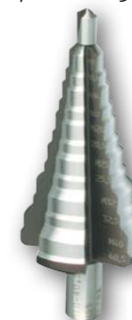
Арт. № 08032 • *