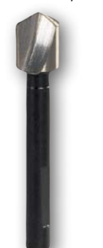
Арт. № 08007