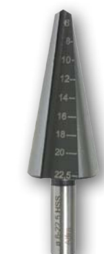
Арт. № 09008*