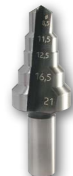
Арт. № 08016

Черновое сверло для листовых пробивных штампов