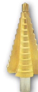
Арт. № 08004 • *