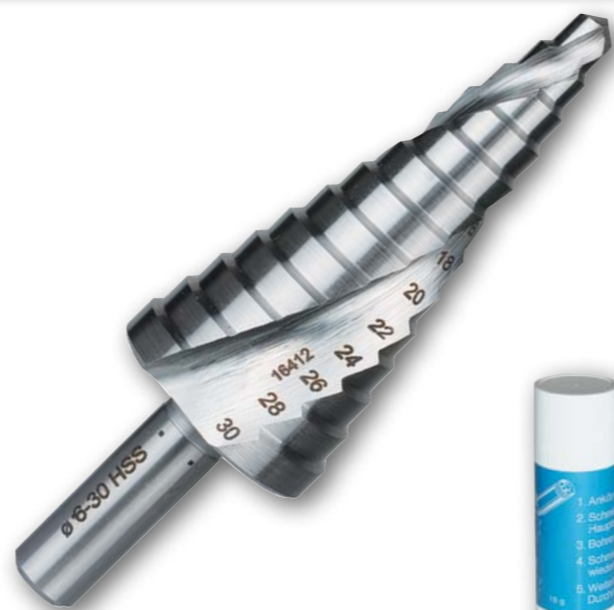
Арт. № 08072