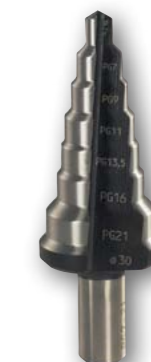
Арт. № 08005 • *