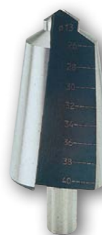
Арт. № 09004