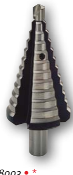
Арт. № 08003 • *