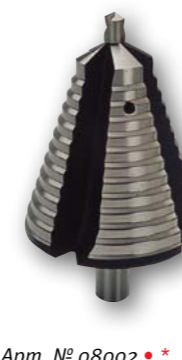
Арт. № 08002 • *