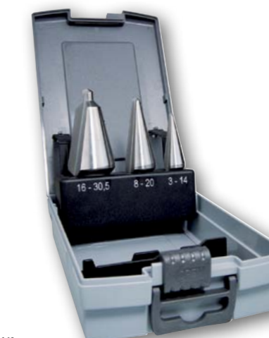
Арт. № 09009