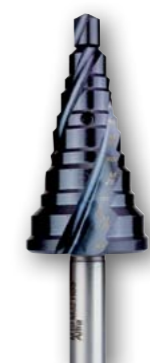
Арт. № 08083 •