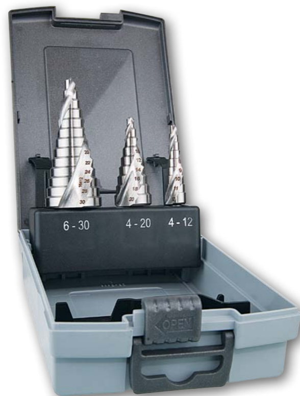
Арт. № 08073