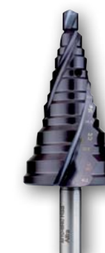
Арт. № 08085 •