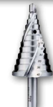
Арт. № 08080 •

• сменное центровое сверло * с 4-мя выемками для стружки