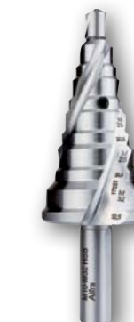
Арт. № 08082 •

Черновое сверло для листовых пробивных штампов